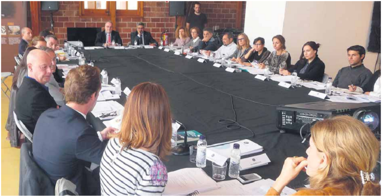
El Consell per al Foment i la Difusió de l'Obra de Gaudí es va reunir ahir a la Nau Gaudí de Mataró ■ L.L.M.