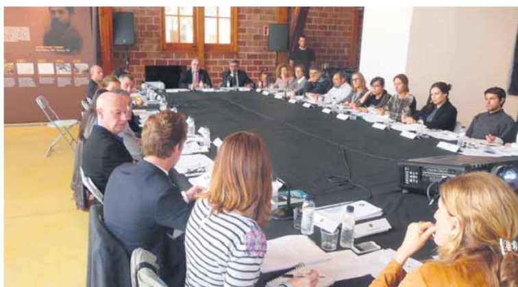
El Consell per al Foment i la Difusió de l’Obra de Gaudí es va reunir ahir a la Nau Gaudí de Mataró ■ L.L.M.

“Un lloc web reuneix per primer cop tota l’obra de Gaudí feta a Catalunya”