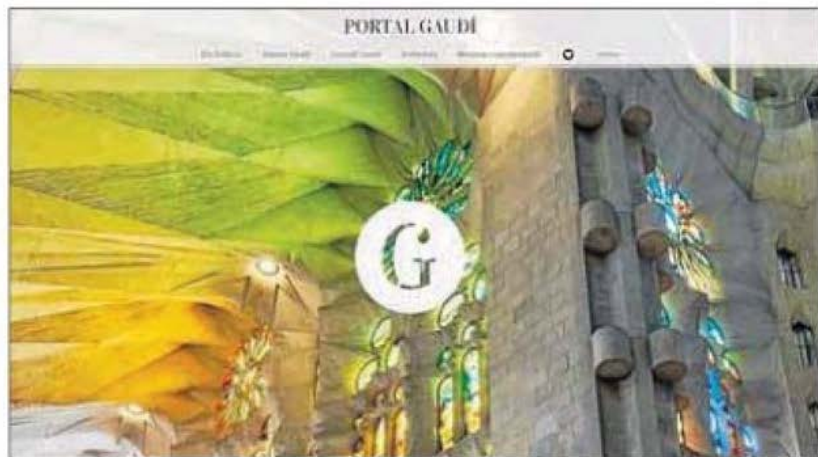
Aspecte del web, que s’ha posat en marxa aquesta setmana.

Portal Gaudí vol fer accessible als usuaris d’arreu del món la història i personalitat d’Antoni Gaudí com a arquitecte universal i tots els béns monumentals que es conserven a Catalunya. Vol ser un lloc de referència per aque-